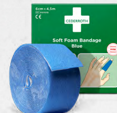
Cederroth Soft Foam Bandage Blue 4,5 m , REF 51011010

Limfritt, självhäftande plåster som lätt kan rivas av efter önskad storlek. Passar på alla typer av sår oberoende av värme, kyla, vått eller torrt. Sitter kvar i vatten. Refill till Första Hjälpen-station.