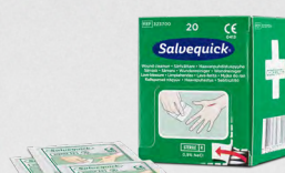
Salvequick Sårvtvättare 20 st REF 323700

Sterilt universalförband med 4 funktioner: Tryck-, stöd-, täck- och brännskadeförband.