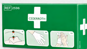
Cederroth Skyddspaket REF 2596

Steril, fysiologisk koksaltlösning, styckförpackade. Refill till Wound Care Dispenser.