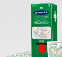
Salvequick Sårvtvättare 40 st REF 3227

Steril, fysiologisk koksaltlösning, styckförpackade. Refill till Första Hjälpen-stationen.