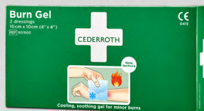
Cederroth Burn Gel Dressing REF 901900

Vattenbaserad gel för mindre brännskador, skällningar och solsveda. Fungerar som en tillfälligt skyddande barriär som kyller och lugnar huden och därmed minskar smärtan. Kan användas flera gånger.