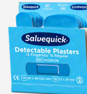
Salvequick Blue Detectable REF 51030127

Extra mjuka och följsamma. Detekterbara i de flesta metalldetektorer som används inom livsmedelsindustrin. Varje refill innehåller 30 plåster (15 st 66 x 39 (22) mm och 15 st 72 x 19 mm). 6 refiller/ask.