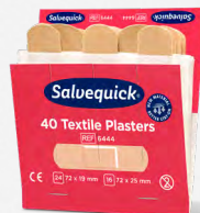
Salvequick Textilplåster REF 6444

Varje refill innehåller 45 plåster (27 st 72 x 19 mm och 18 st 72 x 25 mm). 6 refiller/ask.