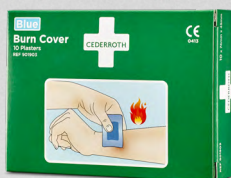
Cederroth Burn Cover REF 901903

Blått Hydrogelplåster som skyddar och lindrar vid mindre brännsår. Burn Cover är också lämplig för mindre skärsår och skrubbsår. Vattentäta och sterila.