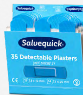
Salvequick Blue Detectable Mix Fingertip/Regular , REF 51030126

Varje refill innehåller 40 plåster (24 st 72 x 19 mm och 16 st 72 x 25 mm). 6 refiller/ask.