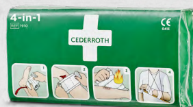
Cederroth 4-in-1 Blodstoppare REF 1910

Sterilt universalförband med 4 funktioner, speciellt lämpligt för fingrar och tår.