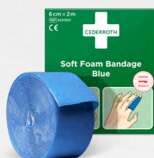
Cederroth Soft Foam Bandage Blue 2 m , REF 51011011

Minskar risken för kontakt mellan hjälpare och skadad. Innehåller andningsmask med backventil, 2 par handskar och 2 st Cederroth Safety Hand Cleaners.