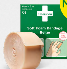
Cederroth Soft Foam Bandage Beige 6cm x 2m , REF 51011019

Limfritt, självhäftande plåster som lätt kan rivas av efter önskad storlek. Passar på alla typer av sår oberoende av värme, kyla, vått eller torrt. Sitter kvar i vatten. Refill till First Aid & Burn Station.