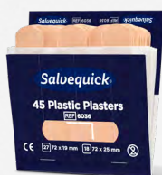
Salvequick Plastplåster REF 6036

Limfritt, självhäftande plåster som lätt kan rivas av efter önskad storlek. Passar på alla typer av sår oberoende av värme, kyla, vått eller torrt. Sitter kvar i vatten. Refill till Wound Care Dispenser.